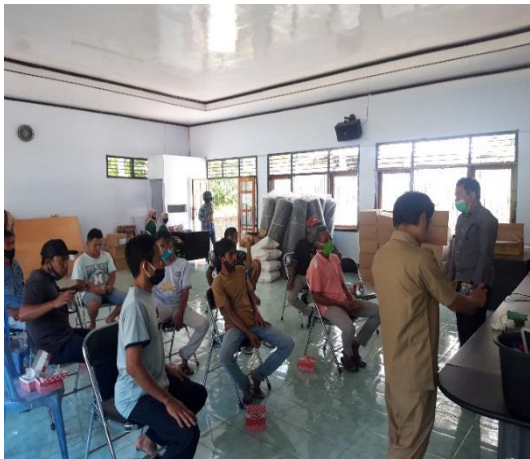
Gambar 2. Penyampaian materi penyuluhan minyak atsiri kayu putih

Penyampaian materi dilakukan dengan metode ceramah dan demonstrasi yang dilanjutkan dengan diskusi, sehingga menimbulkan interaksi antara peserta dengan narasumber. Adapun materi yang disampaikan selain yang telah diuraikan sebelumnya juga didiskusikan potensi bisnis dari tumbuhan kayu putih.