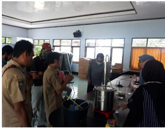
Gambar 3. Suasana demonstrasi penyulingan minyak atsiri kayu putih