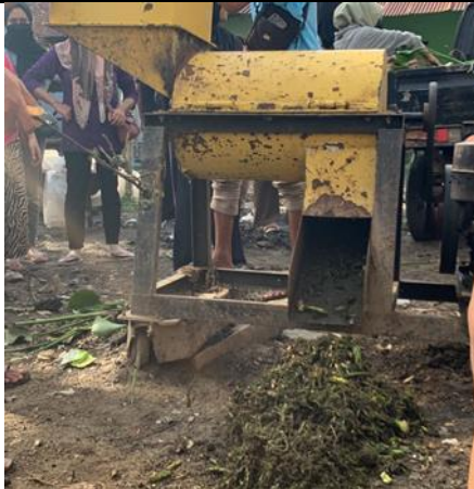
Gambar 4. Proses penggilingan

Setelah campuran eceng gondok dan bahan-bahan tambahannya halus, maka campuran tersebut akan di ratakan setinggi 30 cm, setelah ditumpuk, campuran eceng gondok yang telah halus tersebut akan disiram menggunakan EM4 untuk proses pengkomposan.