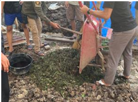
Gambar 5. Proses penumpukan dan penyiraman EM4

Setelah campuran eceng gondok dan bahan-bahan tambahannya halus, maka campuran tersebut akan di ratakan setinggi 30 cm, setelah ditumpuk, campuran eceng gondok yang telah halus tersebut akan disiram menggunakan EM4 untuk proses pengkomposan.