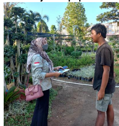
Gambar 14. Promosi dan penyebaran pamflet pupuk eceng gondok

Sedangkan pemasaran secara online dilakukan melalui media sosial dan juga platform e-commerce . Media sosial yang digunakan untuk memasarkan produk pupuk eceng gondok adalah Facebook. Sedangkan platform e-commerce yang digunakan adalah Shopee dan juga Tokopedia. Sosial media dan platform e-commerce digunakan untuk memperluas jangkauan pasar sehingga konsumen tidak hanya berasal dari wilayah Lombok Tengah saja, namun juga seluruh Indonesia.