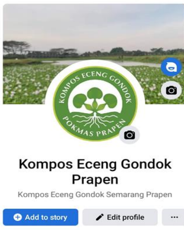
Gambar 15. Facebook untuk pemasaran secara online