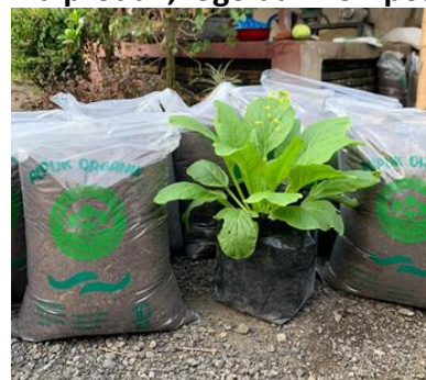
Gambar 11. Kemasan pupuk eceng gondok yang telah digunakan

Tidak hanya mendesain logo dan kemasan, pamflet juga dibuat sebagai salah satu alat promosi untuk keperluan pemasaran secara offline . Promosi menggunakan pamflet dilakukan karena beberapa alasan, diantaranya adalah pamflet sangat efektif untuk promosi jangka