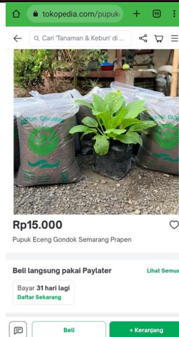
Gambar 17. Tokopedia untuk pemasaran secara online