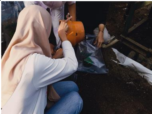
Gambar 9. Proses pengemasan

Setelah pupuk eceng gondok di ayak, maka hasil ayakan tersebut akan dikemas kedalam plastik kemasan dan siap untuk dipasarkan.