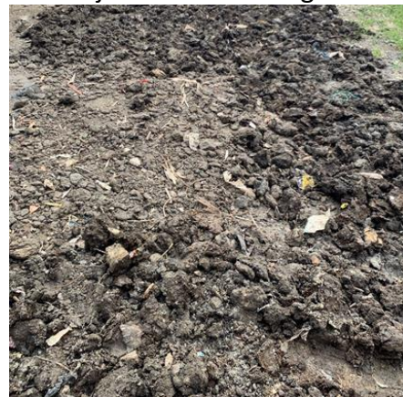
Gambar 7. Eceng gondok yang telah menjadi pupuk

Setelah proses pengkomposan terjadi, maka akan dilakukan proses penggilingan sekali lagi. Setelah pupuk menjadi lebih halus, maka tahap terakhir adalah tahap pengayakan agar pupuk eceng gondok menjadi lebih halus lagi.