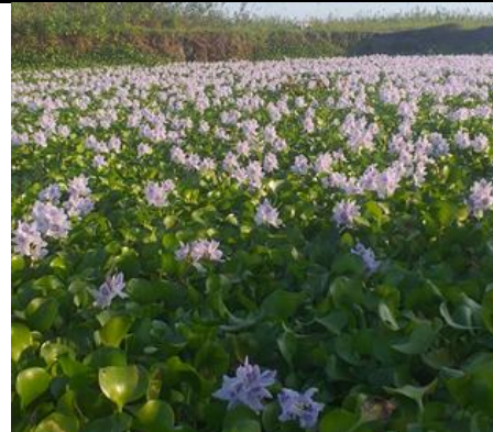
Gambar 2. Eceng Gondok di Kelurahan Prapen

Pemanfaatan eceng gondok dikelurahan Prapen ini tidak hanya untuk menanggulangi gulma eceng gondok yang berada diwilayah perairan kelurahan Prapen, namun pemanfaatan eceng gondok sebagai pupuk organik ini dapat meningkatkan perekonomian warga dengan memasarkan produk pupuk organik tersebut kepada masyarakat luas.