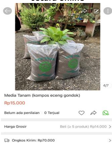
Gambar 16. Shopee untuk pemasaran secara online