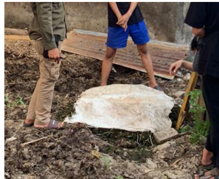
Gambar 6. Proses penutupan

terjadi. Proses ini dilakukan dalam waktu 2 minggu-1 bulan, hingga campuran eceng gondok