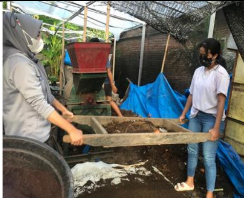
Gambar 8. Proses pengayakan

Setelah pupuk eceng gondok di ayak, maka hasil ayakan tersebut akan dikemas kedalam plastik kemasan dan siap untuk dipasarkan.