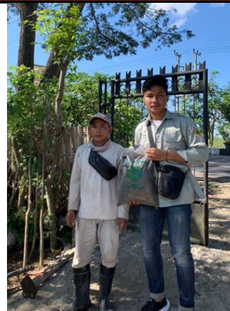
Gambar 13. Penjualan pupuk secara offline

Pemasaran pupuk eceng gondok dilakukan secara offline dan juga online. Pemasaran secara offline dilakukan dengan mengunjungi beberapa toko bibit yang berada di wilayah Kabupaten Lombok Tengah dan Kota Mataram yang juga dibarengi dengan penyebaran pamflet.