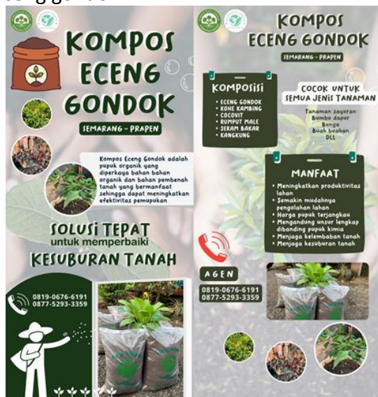
Gambar 12. Desain Pamflet

Desain pamflet yang dibuat terdiri atas beberapa informasi seperti penjelasan terkait produk, komposisi dan juga manfaat pupuk eceng gondok. Pada pamflet ini juga tertera kontak agen dan dimasukkan juga beberapa gambar tumbuhan yang merupakan hasil dari penggunaan pupuk eceng gondok.