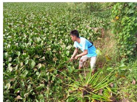
Gambar 3. Proses pengambilan eceng gondok

Terdapat beberapa tahap yang dilakukan dalam proses pembuatan eceng gondok. Tahap pertama adalah pengambilang eceng gondok diwilayah perairan. Setelah eceng gondok terkumpul, proses selanjutnya adalah menghaluskan eceng gondok dengan bahan-bahan lainnya, seperti kohe kambing, cocovit, rumput male, sekam bakar dan kangkung menggunakan mesin penghalus. Dimana dalam proses pencampuran dan penghalusan ini, presentase eceng gondok yang digunakan adalah sebesar 60%.