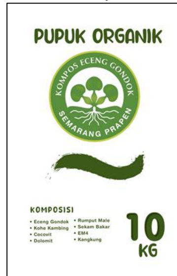
Gambar 10. Desain Kemasan (Terdiri atas nama produk, logo dan komposisi)

Kemasan pupuk eceng gondok kelurahan Prapen terdiri dari dua warna, yaitu hijau tua dan hijau muda. Pada desain logonya, hijau muda menjadi warna dasar dengan gambar tumbuhan eceng gondok dibagian tengah, serta nama dan asal produk pada pinggiran atas juga bawah. Sedangkan untuk nama produk, berat dan komposisinya memiliki warna dasar hijau tua.